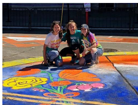
Art and Activism for Climate Action, Climate Action March, San Francisco, 2018